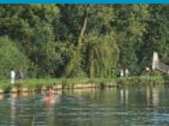
Lieu de retrouvailles avec soi-même et les autres, le chemin de halage permet de croiser des amateurs de jogging, de vélo, de canoë ou simplement des promeneurs.

Près du cœur de la ville se déploie une véritable mosaïque de petits jardins flottants colorés et enchanteurs : les hortillonnages. Les pêcheurs profitent volontiers du calme ambiant pour lancer leur ligne dans les rieux, où fraient et frétilent anguilles et goujons. Ce lieu idyllique est le fuit du travail des hommes. Ce sont eux qui ont façonné ces îlots très fertiles, gagnés sur les marais au fil du temps.