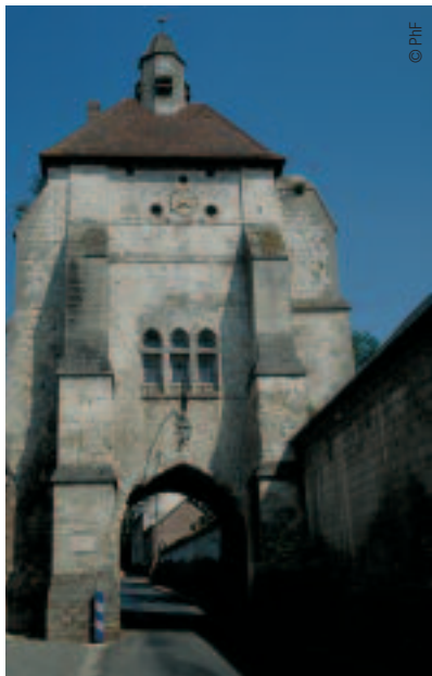
LE BEFFROI DE LUCHEUX

A côté, la chapelle ruinée. "Elle était bâtie au bord du fossé, précise Vincent Vasseur car on n'attaquait pas un édifice religieux. Le reste du château était protégé par ailleurs".