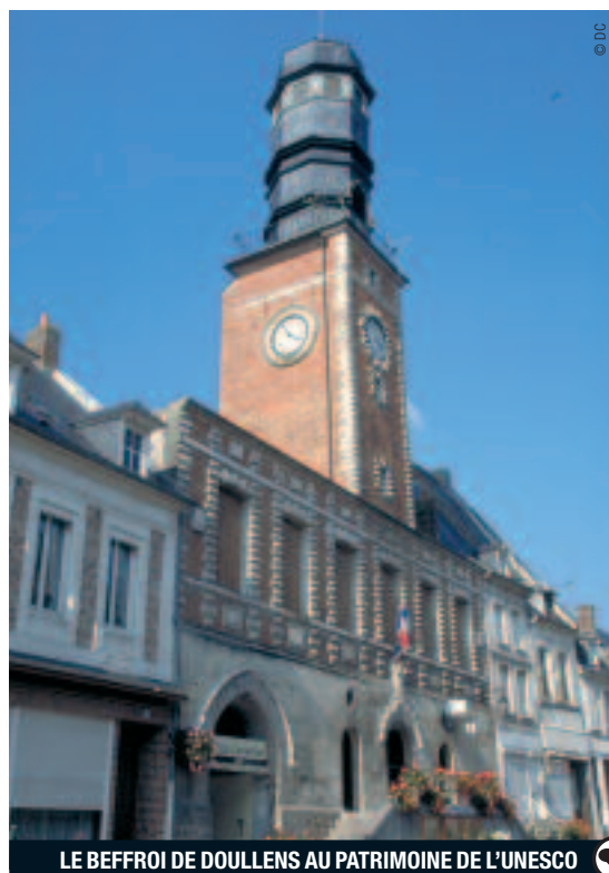
LE BEFFROI DE DOULLENS AU PATRIMOINE DE L'UNESCO

"Vous pouvez y admirer des œuvres d'artistes locaux, note Vincent Vasseur, comme des dessins du caricaturiste de presse Poulbot (1879-1946), dont la famille était originaire du village voisin de Neuville, des sculptures, des silex taillés, l'ancien géant Florimond et même une momie..." . Le 28 juin, à l'occasion des 100 ans de la donation, une grande fête sera organisée à Doullens. Il se murmure que des façades seront décorées et de nombreux commerçants déguisés en costumes 1900 !