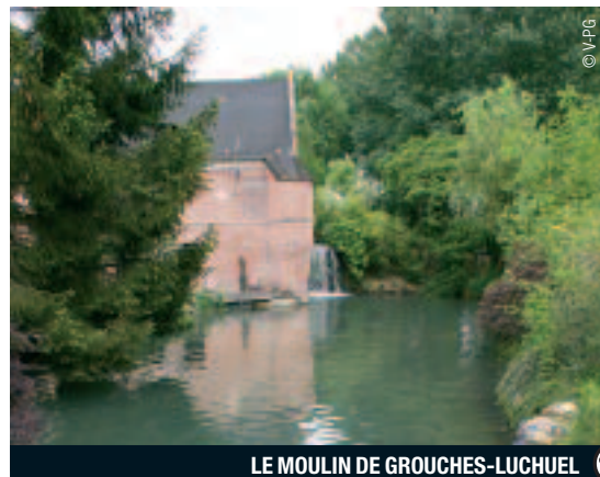
LE MOULIN DE GROUCHES-LUCHEUX

tes. "Lucheux est l'un des rares villages de la Somme qui possède encore les trois édifices de la société française moyenâgeuse : l'église du clergé, le château-fort de la noblesse et le beffroi du tiers Etat," précise Vincent Vasseur. Sur la charmante place du village subsistent de belles demeures du XVIII ème siècle, dont l'actuelle mairie. Honneur au beffroi** installé à deux pas sur l'ancienne porte de la ville fin XIII ème , et lui aussi classé au patrimoine mondial de l'UNESCO. Au premier étage, une salle rappelle que le 19 juin 1464, Louis XI a institué la poste royale aux chevaux, l'ancêtre de notre Poste actuelle. Au pied, une plaque témoigne du passage de Jeanne d'Arc en 1430. La Pucelle aurait été enfermée dans la prison des bourgeois du château fort. Le seigneur de Lucheux était en effet Jean de Luxembourg, qui l'avait vendue aux Anglais. Le château fort** des XII ème XIII ème et XIV ème siècles, qui domine le village, occupait une place stratégique. Malheureusement, la forteresse a été démantelée sur ordre de Richelieu. Marchez sur le sol pavé pour pénétrer dans ce lieu qui appartient à la