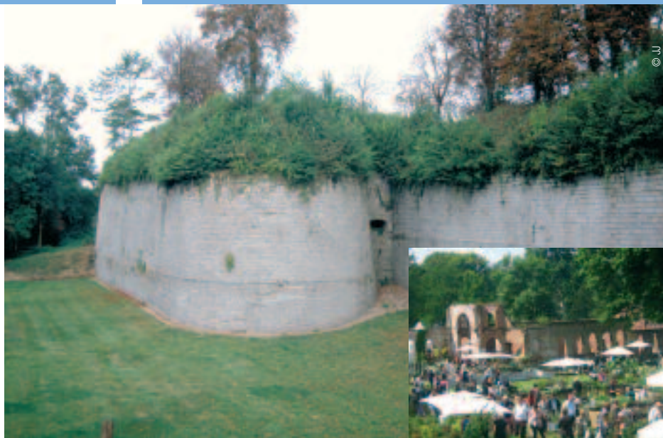
Plus de 5 500 visiteurs se rendent à la fête des plantes, début juin, à la citadelle de Doullens

Direction la cité médiévale de Lucheux. Sur la route, bifurquez par Grouches-Luchuel. Détendez-vous au bord des marais et des larris, pelouses calcaires. Observez la beauté bucolique de l'ancien moulin à eau, qui abrite des chambres d'hô-