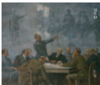
Tableau du Maréchal Foch à la mairie de Doullens

Citadelle, beffrois, château fort : pour se protéger des invasions, le Doullennais a bâti en dur, mais aussi en beau. Poussez donc les portes des trésors de Doullens et de Luzech. Surprises garanties.