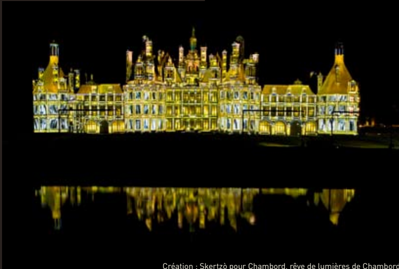
Création : Skertzò pour Chambord, rêve de lumières de Chambord