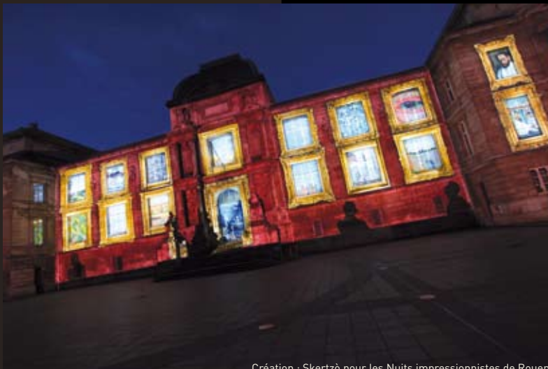
Création : Skertzò pour les Nuits impressionnistes de Rouen

Amiens, la cathédrale en couleurs s'inscrit dans le réseau des spectacles lumière des villes du Mans et de Rouen, et du château de Chambord.