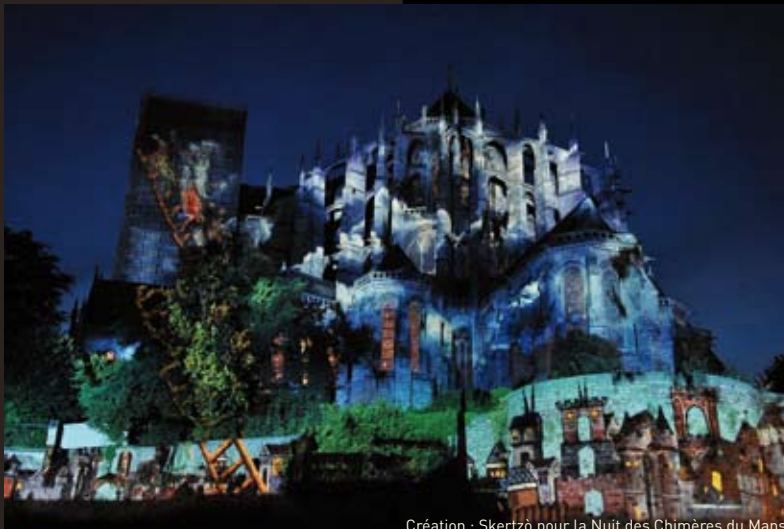
Création : Skertzò pour la Nuit des Chimères du Mans