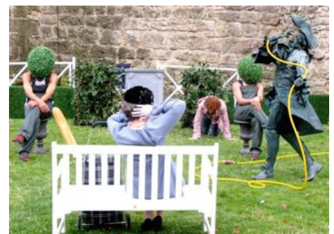
The Royal Deracinemoa Company