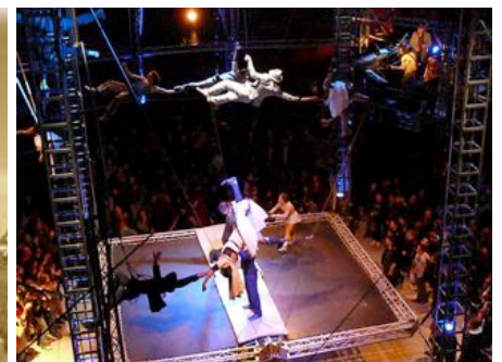
NoFit State Circus